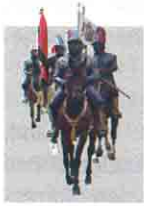
Wallenstein Memmingen 1630

Vom 29. Juli bis 5. August taucht Memmingen ab ins Mittelalter